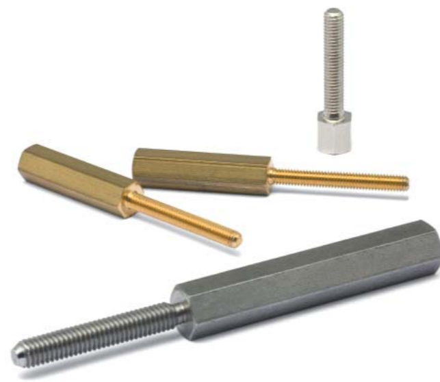
+ mit langem Außengewinde (verschiedene Gewindelängen + -typen möglich)