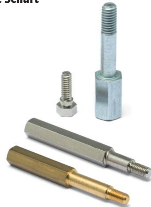
+ mit Schaft