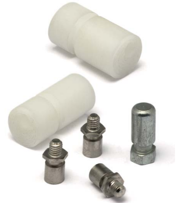
+ mit Einstich