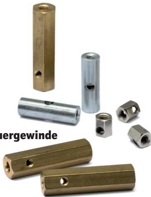
+ mit Querbohrung