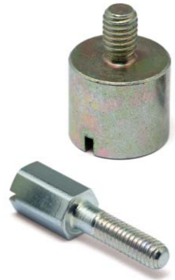
+ mit Schlitz